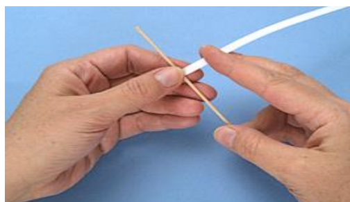
Рис.1 Накручивание полоски

▪ Возьми полоску. Ногтем слегка оттяни и закругли её конец. Положи на него шпажку. Накручивай полосу, стараясь делать первые витки поплотнее (рис.1)