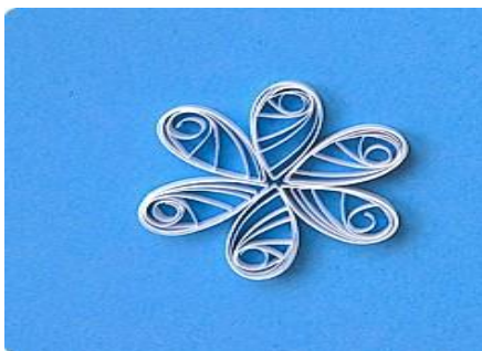
Рис.6 Склеивание шести «капель»