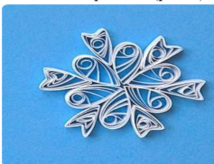
Рис.7 Вклеивание шести «стрелок»