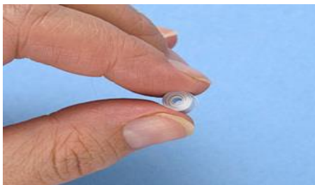
Рис.2 Скручивание шайбы