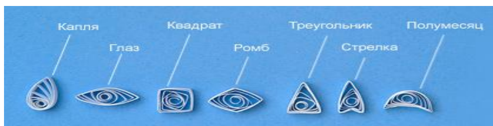
Рис.4 закрытые формы заготовок