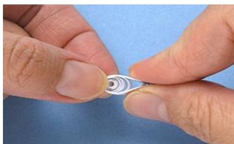
Рис.3 Получение формы «Капля»