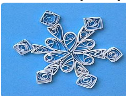
Рис.8 Приклеивание шести «квадратов»